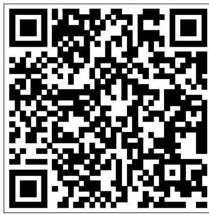
扫码登录校友邮箱